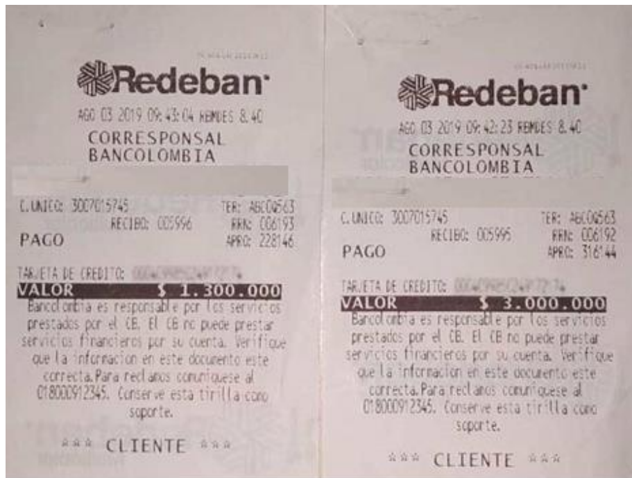
Pantallazos o fotos de productos